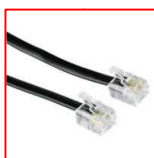
1 câble RJ11*