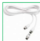
1 câble Coaxial