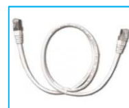
1 câble Ethernet