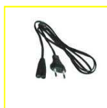
1 cordon d'alimentation